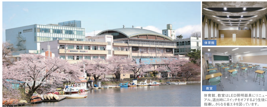
体育館、教室はLED照明器具にリニューアル。退出時にスイッチをオフするよう生徒に指導し、さらなる省エネを図っています。