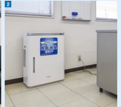
2 自社の各部屋には40畳タイプを設置