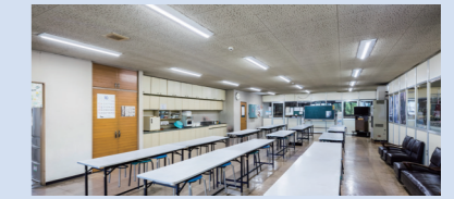
食堂にも同じく部屋全体が均一に明るくなる富士型をご採用

「別会社が提案してきた海外メーカー製のLEDランプは、万一不具合が起きた際の対応に不安がありました。伏見電化センターさんが提案してくれたパナソニック製なら国内メーカーでシェアも高く安心であり、高演色タイプの品揃えも魅力的でした。」