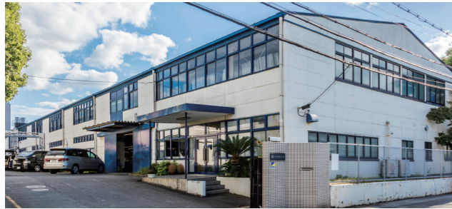
山光化染株式会社 社屋・工場外観