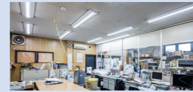
事務室では、製品の色味の確認等を行います。お取引先様によって視環境が異なるため、Ra95の高演色タイプとRa83の通常タイプを交互に設置されています

事務所や倉庫、食堂にも一体型LEDベースライト iDシリーズをご採用。用途に応じて高演色タイプもご採用