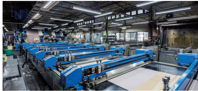
工場内：床面方向が明るくなる反射笠付型をご採用

「照明器具 お手軽割賦サービス」のご採用により、 初期費用なしでLED照明器具へ全面リニューアル。