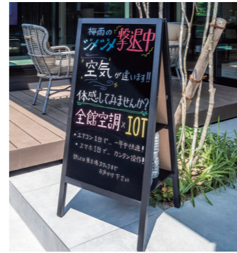
モデルハウス入口 「全館空調×IoT」 訴求看板

全館空調熱交換気システム「with air」とIoTを組み合わせ、「進化する暮らしを上質な空気の中で過ごせる家」をご提供。