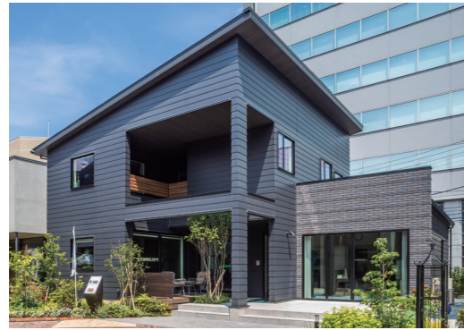
TBCハウジングステーション 仙台駅東口展示場内アイフルホームモデルハウス