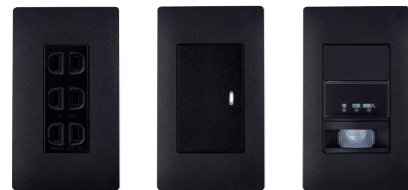
WTA3021B, WTA7101BK, WTL7003BK, WTA1811BK など

これからのスイッチ・コンセントのスタンダード商品、アドバンスシリーズにマットブラック色が追加。