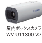
屋内ボックスカメラ WV-U11300-V2

音声情報もあわせて記録 ※ 。接客トラブル時の対応検証や現場状況の確認などにも活用可能。