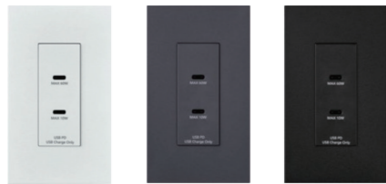
マットセラミックホワイト WTL1488MW

USB Type-C TM *1搭載の埋込充電用USBコンセントで最大60Wを実現。