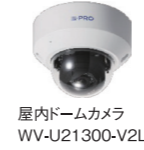
屋内ドームカメラ WV-U21300-V2L