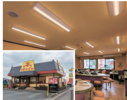
山田うどん 鶴ヶ島店 内装も一新し、iDシリーズの温白色で温かみのある雰囲気。