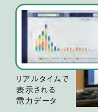
リアルタイムで表示される電力データ