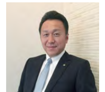
株式会社ハスマ電気 代表取締役

今後はリニューアル需要の獲得に向けてさらに積極的に取り組み、全国各地において展開していければと考えております。