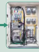
多回路エネルギーモニター