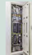
電灯盤内に設置された多回路エネルギーモニター