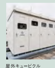
屋外キュービクル