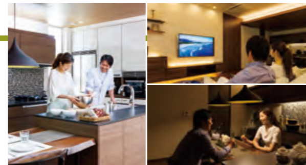
LDKそれぞれの生活シーンに合わせて、あかりの使い分けを体験いただきながらご提案をします。