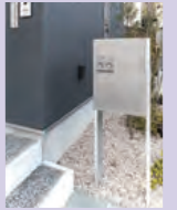
外出中でも荷物が受け取れる宅配ボックス。