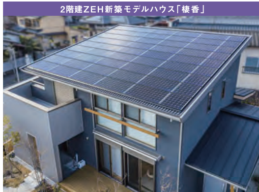
2階建ZEH新築モデルハウス「榎香」