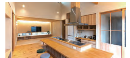
平屋ZEHリノベーションモデルハウス「平家」。

国は2020年までに標準的な新築戸建住宅をZEH化することを目指していますが、エコワークス様では新築だけでなく今後政策的にも重要性の増す既築住宅のZEH化も推進。2030年以降に向けて、ひいては脱炭素社会の実現に向けて、先進的に取り組まれています。