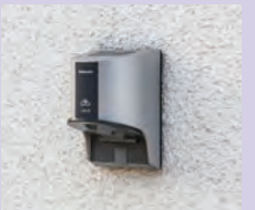
標準採用されているEV充電用屋外コンセント。