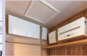
スマートコスモ、太陽光発電用パワーコンディショナ、接続箱。