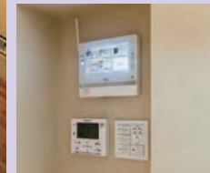
エネルギーモニタとパワーステーションのリモコン設定器。