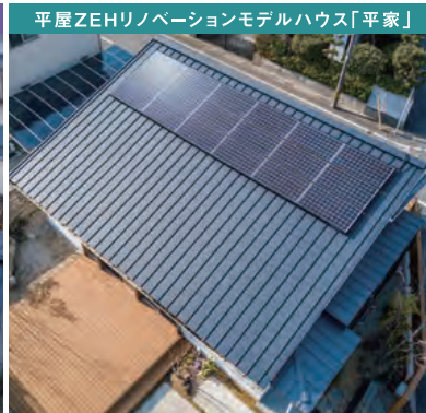
平屋ZEHリノベーションモデルハウス「平家」