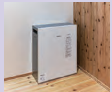
リチウムイオン蓄電池。