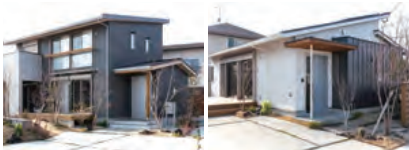
モデルハウス榎香 福岡県 春日市