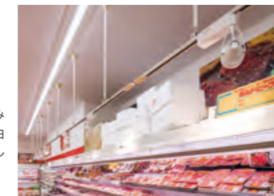
彩光色LEDは肉の赤みをより赤く、白みをより白く強調し、新鮮でおいしそうに演出します。