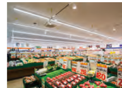
彩光色LEDは自然な光色ながら、野菜を色鮮やかにみずみずしく表現します。

今回の成果が高く評価され、別の2店舗でも照明リニューアルの打診を受けています。すでに1店は現調も済ませ、リニューアルプランもご提案。実施の方向で進んでいます。そして、この第一歩を無駄にしないためにも長期の戦略を検討しています。