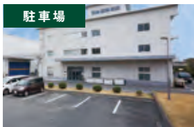
駐車場 監視カメラの設置に