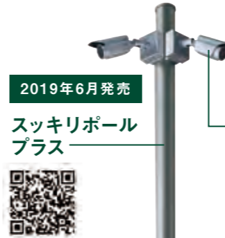
2019年6月発売 スッキリポール プラス