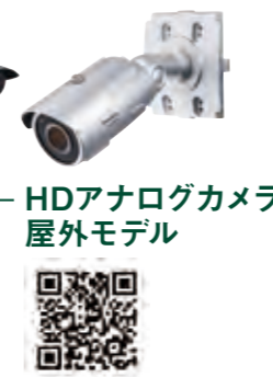
HDアナログカメラ 屋外モデル