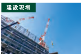
建設現場 仮設設営でのインフラ構築に