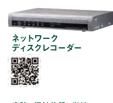
ネットワーク ディスクレコーダー