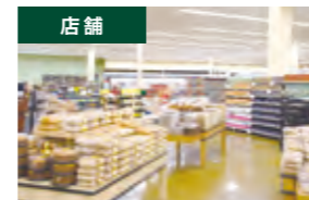
店舗 ネットワークカメラ設置に