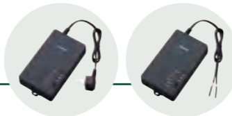
HD-PLC対応 PLCアダプター コンセントタイプ

※「HD-PLC」はパナソニックが提唱する高速電力線通信方式の名称で、日本及びその他の国での登録商標もしくは商標です。なお、PLCはPower Line Communicationの略称です。 ※HD-PLCは2011年に国際標準規格IEEE1901として承認。さらに2019年3月には国際標準規格IEEE1901aとして承認。全世界へ普及。