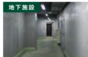
地下施設 無線LANのアクセスポイントに