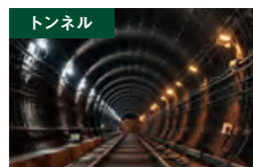
トンネル 長距離トンネル内の通信手段に