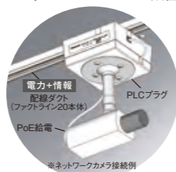
※ネットワークカメラ接続例