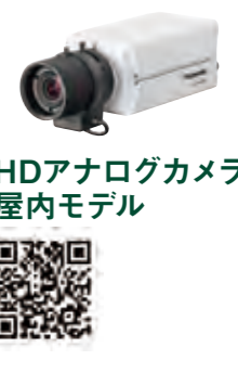
HDアナログカメラ 屋内モデル

最大4台のカメラと接続できるコンパクトレコーダーと組み合わせ、セキュリティ対策に。