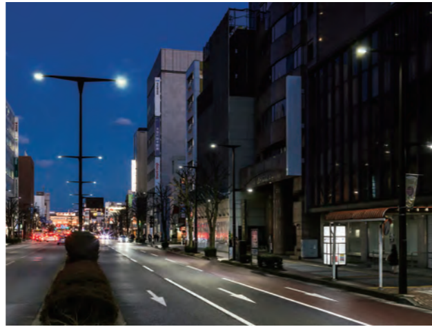
宇都宮市の道路照明。とちぎ県央地区道路照明灯LED化合同会社様にてLED化。

ESCO事業 ※1 により県内の道路照明灯をLED化。県内の事業者間協力や地域間の情報交換により、県内の事業者が大規模受注に成功。