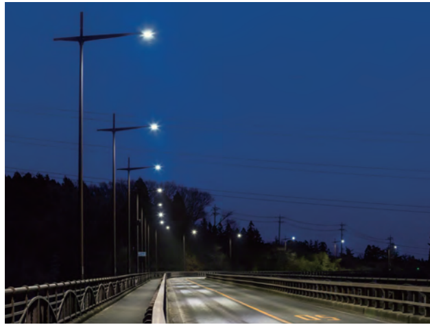
那須塩原市の道路照明。県北外灯LED化有限責任事業組合様にてLED化。