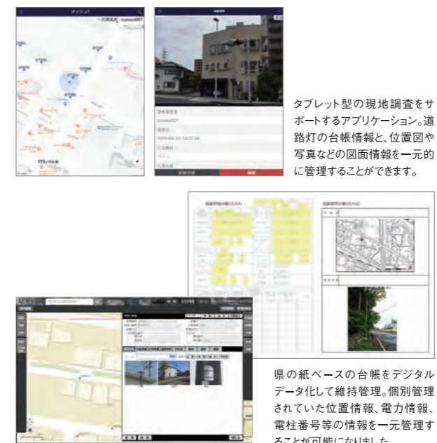
タブレット型の現地調査をサポートするアプリケーション。道路灯の台帳情報と、位置図や写真などの図面情報を一元的に管理することができます。