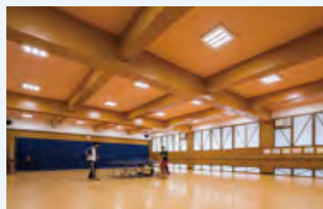
一体型LEDベースライトIDシリーズリニューアル専用器具、LED投光器、エネルギーモニター等をご採用。

九州学院様は、お隣の熊本県にある中高一貫の私立学校です。1910年の創立以来、建学の精神「敬天愛人」と教育目標「自分で自分を監督し、役に立つ善人となれ」を掲げ、在校生や卒業生とその家族、また熊本の人々にも愛される学校を目指して日々教育に取り組まれております。卒業生には多数の有名スポーツ選手を輩出されており、グラウンドや体育館などの施設も充実しています。当初は老朽化した空調設備のリニューアルを設備工事店に依頼されていました。補助金活用の依頼もあったため、弊社の実績を知ったメーカー販売店の方から相談をいただき、九州学院様への営業に同行。現場確認をしたところ、グラウンドに水銀灯があったため、水銀条約による水銀ランプ生産中止についてご説明し、武道場とグラウンド照明のLED化も急務であることをご提案しました。しかし今期は予算がないとのことでした。そこで、これまでの経済産業省の補助金ではなく、補助率の高い環境省の「 二酸化炭素排出抑制対策事業費等補助金 」の申請をご提案。環境省の補助金という新たな分野での実績が欲しかったこともあり、私にとっても新たなチャレンジとなりました。結果、無事採択され、4,700万円の事業費に対し2,200万円の補助金を得られ、投資回収期間が27.6年から14.7年にまで縮まり、電気代も年間約170万円もの削減を見込んでいます。空調設備はもちろん、屋内のLED照明からグラウンドの投光器まで幅広い改修を受注することができました。現時点では実測値で13~20%/月の削減量を確認しており、大きな成果が得られています。