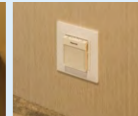
普段は足元灯として、停電時は非常灯になるホーム保安灯。