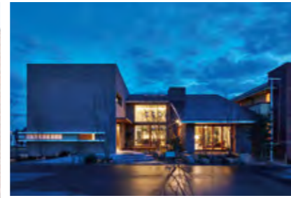
RSKハウジングプラザ グランツ展示場 外観

お客様の現在と未来を考え、スマートコスモ、あかり付の住宅用火災警報器、AiSEG2を全棟に標準採用。