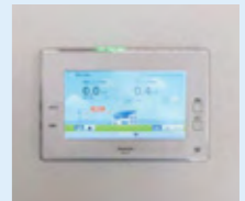
現在建築中のグランツでは、創蓄連携やIoT化に力を入れられています。左から太陽光発電、蓄電池、パワーステーションS、電力切替ユニット、AiSEG2。

もご採用いただいています。2020年からはAiSEG2を全棟に標準採用。2019年度には137棟に太陽光発電をご採用いただきました。