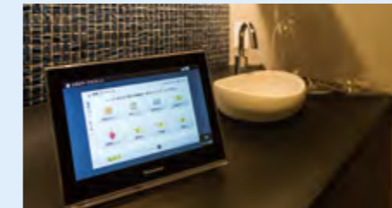
プライベート・ピエラ(住宅機器コントローラーモデル)。普段は足元灯として、停電時は家の中のすべての機器をこのモニターひとつで操作可能。AiSEGと連動してエネルギーの「見える化」も。