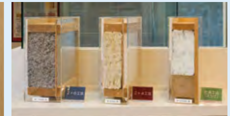
「2×6」「2×4」「在来工法」の違いを現物の断面を使用してご来場者に説明されています。