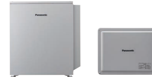
一般仕様 LJB2256 耐塩害仕様 LJB3256 蓄電池用コンバータ 一般仕様 LJDC201 耐塩害仕様 LJDC202