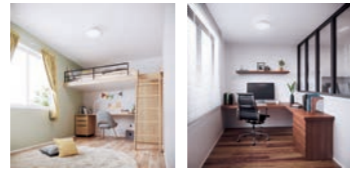
設置イメージ 設置イメージ