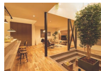
宿泊体験型モデルハウス。「お試し旅館「常春亭」」を県内3会場に合計7棟ご用意されています。24時間快適なYUCACOシステムの体感や間取りの参考になり、お客様にご好評です。

「YUCACO(ユカコ)システム」においても、空調機能のシステムに頼るだけでなく気密・断熱性能や躯体性能も関東・関西とは全く違うレベルで引き上げなくては消費電力量が下がらない、という点がキーポイントです。お客様には数値ではわかりづらい快適性を実感していただくために、モデルハウスでの宿泊体験を継続的に実施しています。