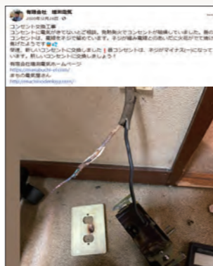
発熱発火でコンセントが破損した事例 お客様の了承を得て、フェイスブックやホームページに掲載されています。