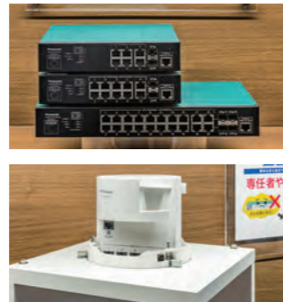
PoEスイッチングハブ GA-ML/FA-MLシリーズ