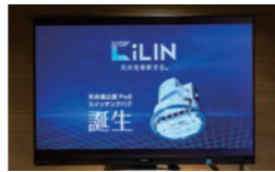
天井埋込型PoEスイッチングハブ「CiLIN」