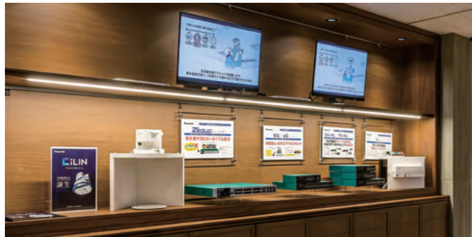
スイッチングハブ展示コーナー