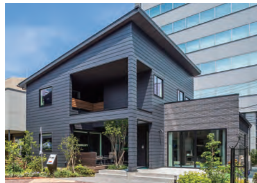
TBCハウジングステーション 仙台駅東口展示場内アイフルホームモデルハウス