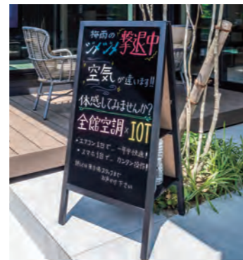
モデルハウス入口「全館空調×IoT」訴求看板

全館空調熱交換気システム「with air」とIoTを組み合わせて、「進化する暮らしを上質な空気の中で過ごせる家」をご提供。