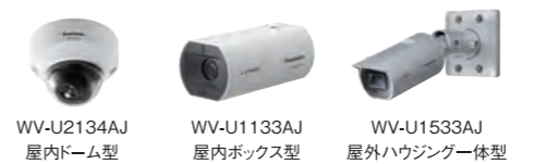
WV-U2134AJ 屋内ドーム型 WV-U1133AJ 屋内ボックス型 WV-U1533AJ 屋外ハウジング一体型

i-PROシリーズの基本的な性能を踏襲、高品質を維持、使いやすさにこだわり、監視システムの機能を強化して新発売。