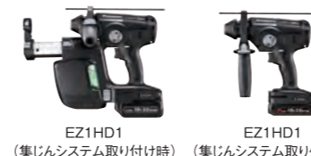
EZ1HD1 (集じんシステム取り付け時) EZ1HD1 (集じんシステム取り外し時)