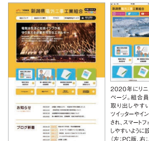
2020年にリニューアルしたホームページ。組合員様に必要な情報を取り出しやすいデザインに変更。ツイッターやインスタグラムもスタートされ、スマートフォンで投稿や閲覧がしやすいように設計されています。(左:PC版、右:スマホ版)