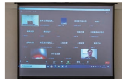
オンライン開催の様子 本部では委員会と事務局のメンバーのみが参加。組合員様は各支部または本社にて視聴されました。