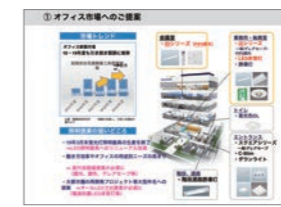
[パナソニックによるセミナー] ストック需要LED化提案研修会 ～計画的電気設備リニューアルのススメ～ 1、設備の耐用年数を把握して対策をスケジュール化 2、使えなくなる可能性のある機器への対策 3、複数機器の工事を同時に行い、機能上げる の3つを中心に、計画的リニューアルを進める際のポイントについてご紹介させていただきました。