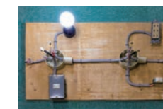
出前授業の際に持参するキット。スイッチを押すと電球が点灯する仕組みやコンセントに電化製品を差し込むと動く仕組みを電気回路を使って説明します。