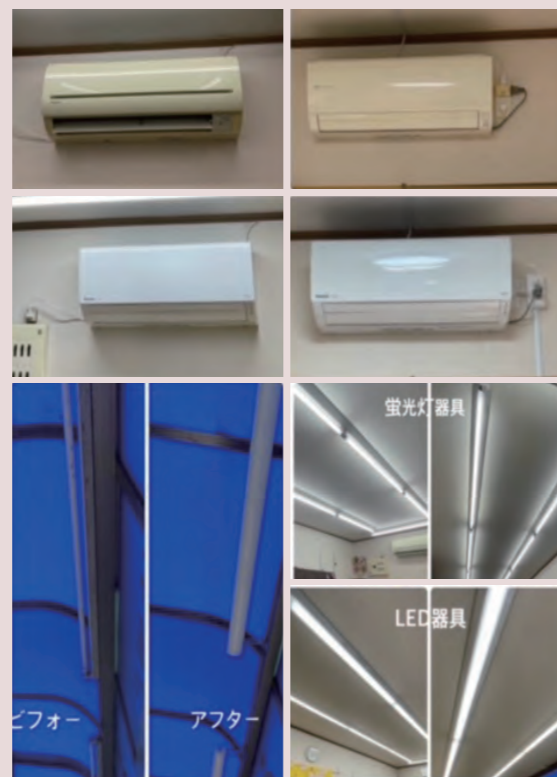
補助金活用店舗改修施工事例のフェイスブック掲載例

これからもお客様のお困りごとを一つずつ解決しながら、営業のヒントを見つけていきたいと思っています。