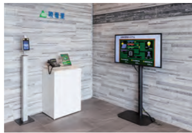
1階受付に設置されている太陽光発電システムのモニター