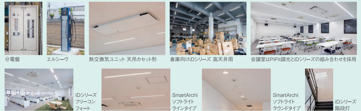
分電盤 エルシーヴ 熱交換気ユニット 天吊カセット形 倉庫向けiDシリーズ 高天井用 会議室はPiPiit調光とiDシリーズの組み合わせを採用 iDシリーズ フリーコンフォート SmartArchi ソフトライト ラウンドタイプ SmartArchi ソフトライト ラウンドタイプ iDシリーズ 階段灯

人規模の会議室も設けました。これまでは新商品内覧会は会場を借りて行っていたのですが、これからはこの社屋で行います。同時に当社の建物全体もご覧いただく予定です」とお話しくださいました。