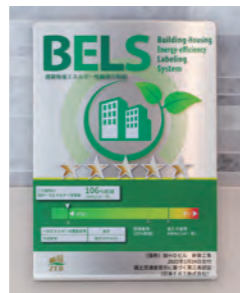
国土交通省が定めた「建築物の省エネ性能表示のガイドライン」に基づく第三者認証「BELS」の最高ランクを獲得