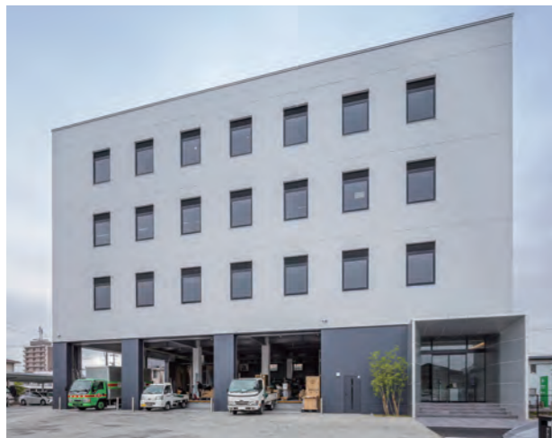
旭ホールディングスビル(暁電業新社屋)