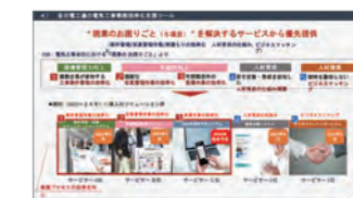
電気工事業会社様におけるお困りごとが紹介され解決策として全日電工連様の電気工事DX支援ツールが紹介されました。