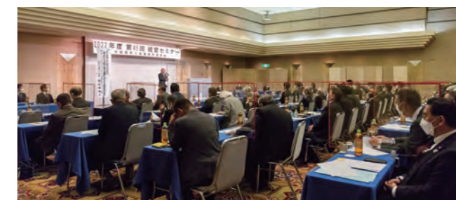
セミナー受講の様子