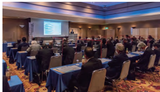
セミナーには中部電気工事業組合連合会の役員と各県青年部の役員計78名が参加されました