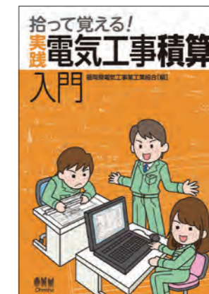
初心者向け積算講習会のエッセンスがそのまま書籍化された「拾って覚える! 実践 電気工事積算入門」 オーム社刊 2,530円(本体2,300円+税)

物を命を吹き込む仕事だと思うのです。昨今の社会情勢から物価上昇や電気代の値上がりなど、業界を取り巻く環境に変化はありますが、全国の青年部の仲間とこの業界を盛り上げ、発展につなげたいと思っています」と抱負を語られました。