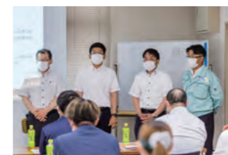
今回は約20名の方が受講され、熱心に講師の話に耳を傾けておられました。青年部の役員が講師を務め、受講者の質問にも青年部の方々が細やかに対応されています。