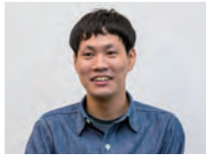
照明環境解析課 山河