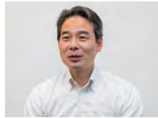
照明環境解析課 福島