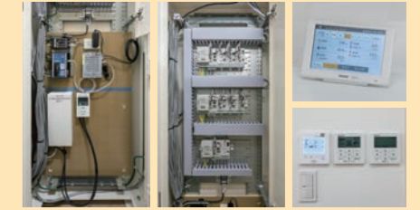
エマネージ・多回路エネルギーモニター