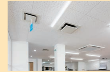
空調三連携(左から天井埋込形ジアイーノ・ 全熱交換器・ビル用マルチエアコン)