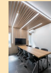
LEDベースライト sBシリーズ