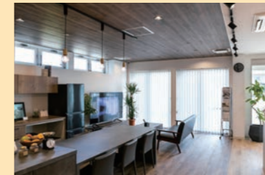
LEDペンダント・LEDスポットライト