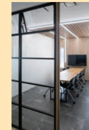
ペリテイスしきり窓