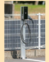
電気自動車充電設備 エルシーヴ+Dポール