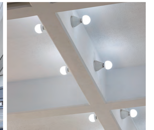
1階エントランスホールの吹き抜けは、大空間の雰囲気を損なわないように、オリジナルの光源に近付けるよう選択してLED化を実現しています。