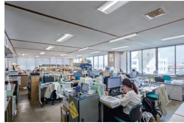
執務室はPIpit調光シリーズのLEDベースライトをご採用。昼光センサを組み合わせ、自動で一定の明るさに調光。タイム設定で17時半以降は照度を60%に落としています。さらにハンディライコンを使って調光したい器具に向けて個別に操作することも可能なため、不在席の頭上のみ消灯するなど、細かな省エネが可能です。