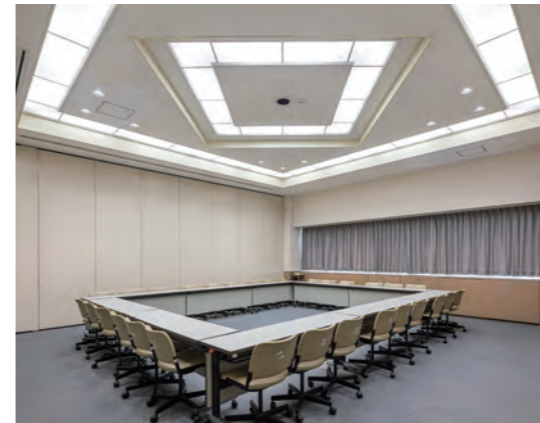
会議室はLEDスクエアベースライトを組み合わせ意匠を表現。