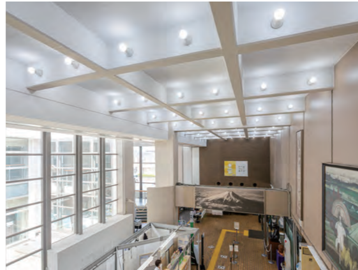
朝霞市役所 エントランスホール