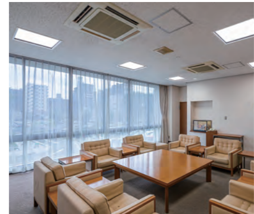
議場棟の議員控室や廊下にはスクエアタイプのLEDベースライトをご採用。