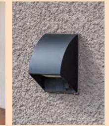
屋外用スマート 防水コンセント