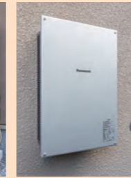
パワーステーション