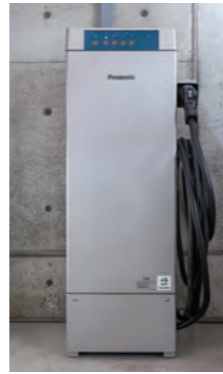
V2H蓄電システムeneplat V2Hスタンド

カーボンニュートラルとレジリエンスを両立する暮らしを目指し 太陽光発電・蓄電池・電気自動車を同時に制御できる V2H蓄電システム「eneplat」 エネプラット をご採用。