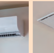
熱交気調システム +空気清浄機 Air Me