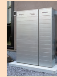
家庭用燃料電池 エネファーム