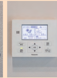
V2H蓄電システムeneplat ネットリモコン