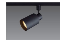
ダクト用スポットライト XAS5521LCC1 直付フランジタイプ、 本体色ホワイト仕上も品揃え