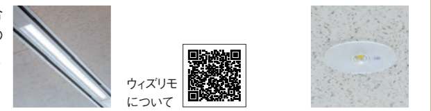
ウィズリモ について

システム天井用照明器具ラインシリーズにウィズリモライトバーを組み合わせてご採用。施工後に約70%に調光されています。人がいない書棚の上などは消灯し、さらに省エネ。会議室やビジターセンターなどでは、モニターやプロジェクターの上だけを消灯して、映像を見やすくされています。LED非常用照明器具 専用型も約2,000台ご採用いただきました。