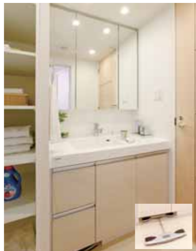
「常にきれい」の理想に応える洗面化粧台 i-X

物件名：アルシア溝の口 所在地：神奈川県川崎市高津区 事業主：ナイス株式会社 設計・監理：株式会社INA新建築研究所 施工：松井建設株式会社 敷地面積：979.42㎡ 建築面積：506.27㎡ 建築延面積：2,289.04㎡ 構造・階数：鉄筋コンクリート造 地上6階建 総戸数：36戸 (1LDK～4DK) 竣工予定：2011年2月下旬