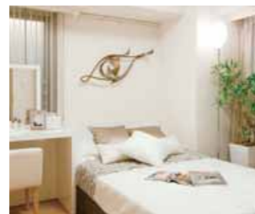
コンパクトながら2面採光の主寝室