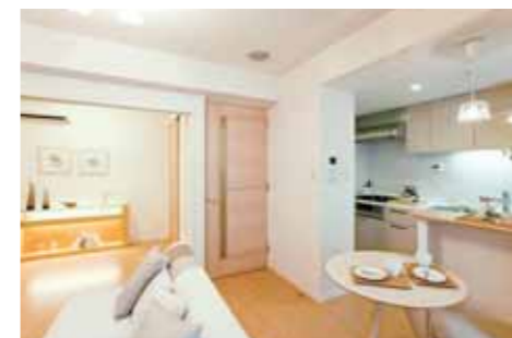
スライディングウォールを全開すれば約15帖のLDK