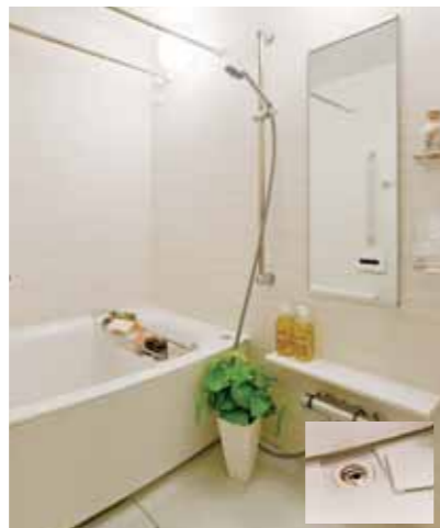
お手入れも楽なゆとりあるバスルーム i-X