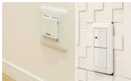
センサー付の足元灯(左)やワイドスイッチ(右)で夜間も安心