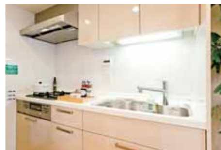
料理好きも納得の機能的なキッチンLS-i