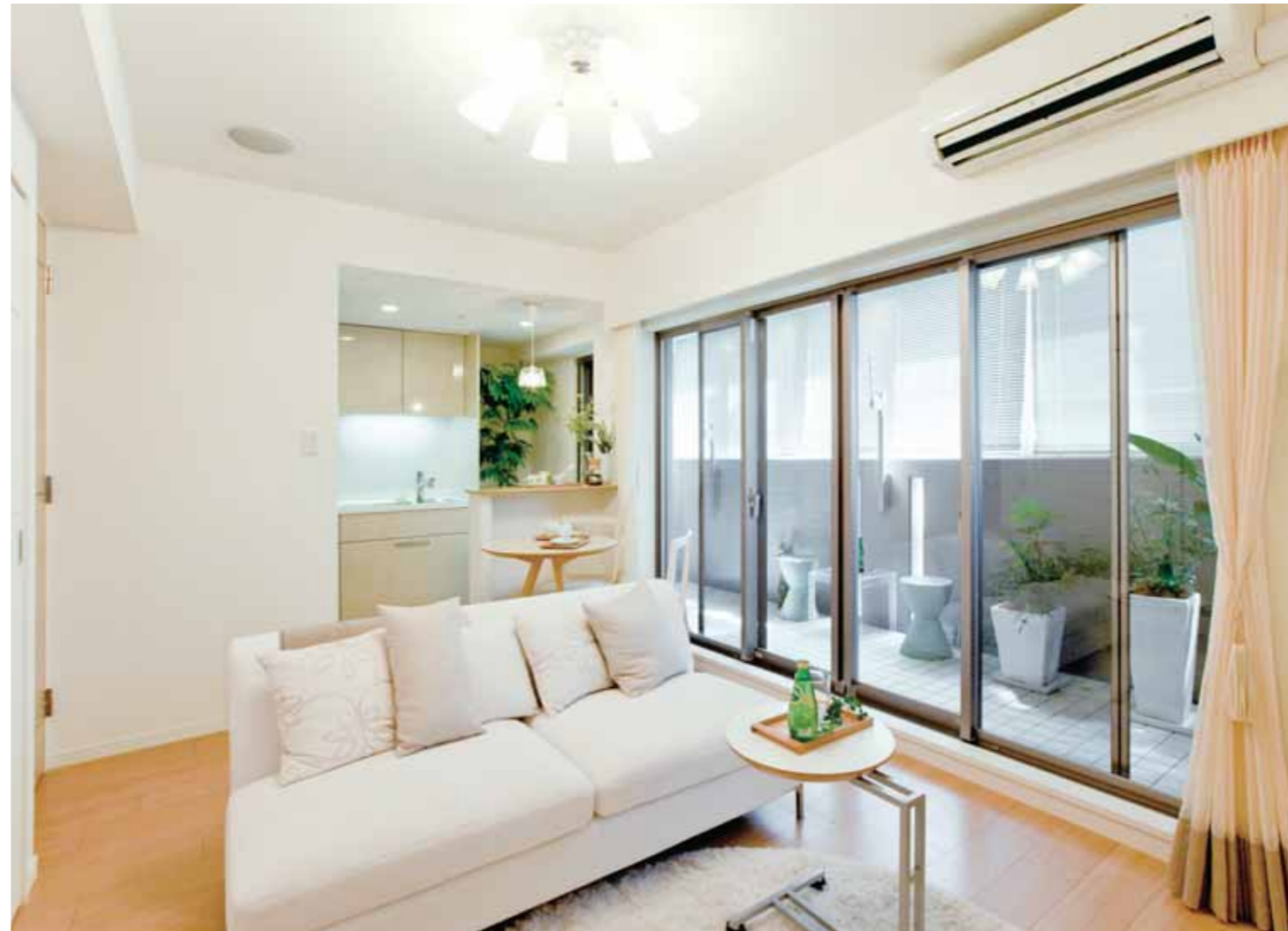
セミクローズのキッチンで奥行きを演出、ワイドなベランダ開口で広がりを感じさせるリビング・ダイニング