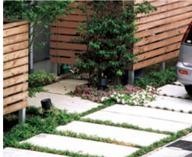
駐車スペースは板塀前の石畳、自動車がないときは子供たちの遊び場に