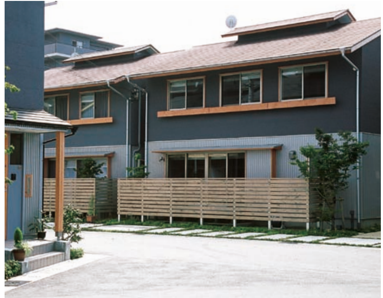
無垢材がアクセントとなっている落ち着いた家並み、道路にはイロハモミジ、常緑のソヨゴが並ぶ