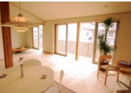
開放感あふれる2階リビングプラン

もちろん、基本は「永く愛着を持って住める家」です。そのために地域の風土に合った木材を使い、住まう方々にその価値感を共有いただいていることも、街づくりの大きな力となっています。