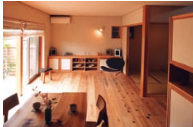
開口部を広くとり、奥行きと広がりを感じさせる明るいリビング