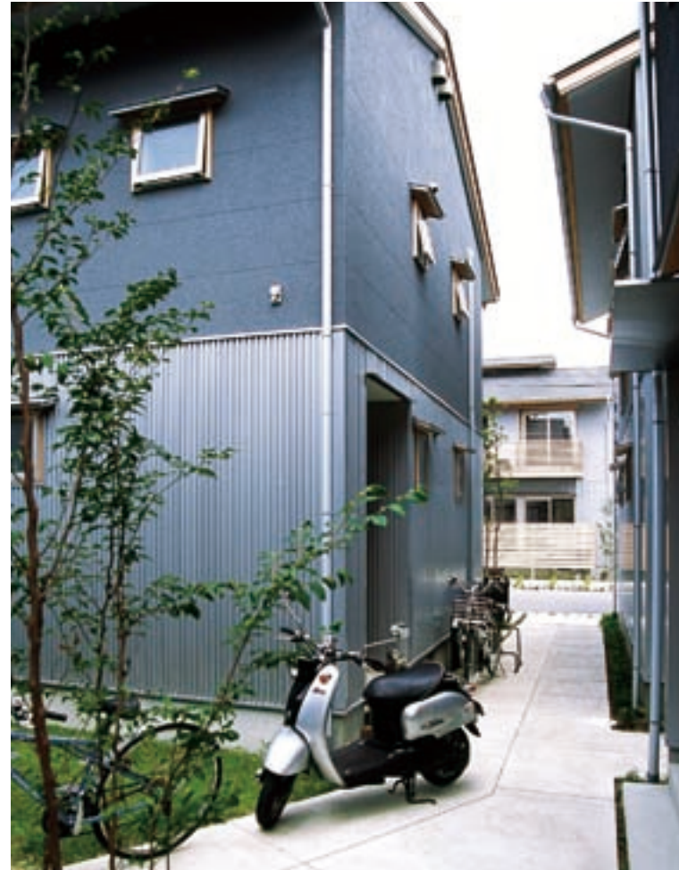
路地に面した玄関や窓は、のぞきこめないようにずらしてプライバシーを守る