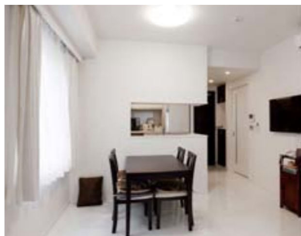
ご両親のリビングステーションはセミオープンで落ち着いた雰囲気(2階)