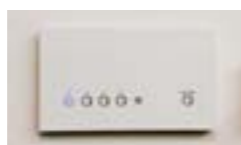
ワンタッチで複数のあかりをコントロールできるリビングライコン