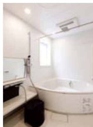
外光を取り入れた開放感あふれるバスルームココチーノLクラス(4階)