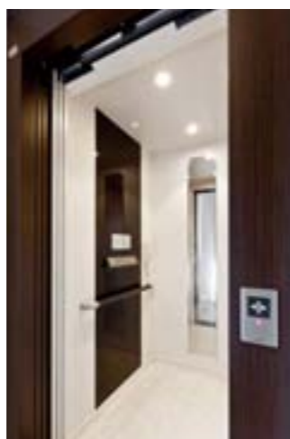
ご両親のために採用されたホームエレベーター

■DATA 所在地：東京都中央区 設計・監理：株式会社 松下産業 一級建築士事務所 施工：株式会社 松下産業 敷地面積：63.29m 2 建築面積：49.49m 2 建築延面積：253.61m 2 構造・階数：鉄筋コンクリート造、地上5階建 竣工：平成23年9月