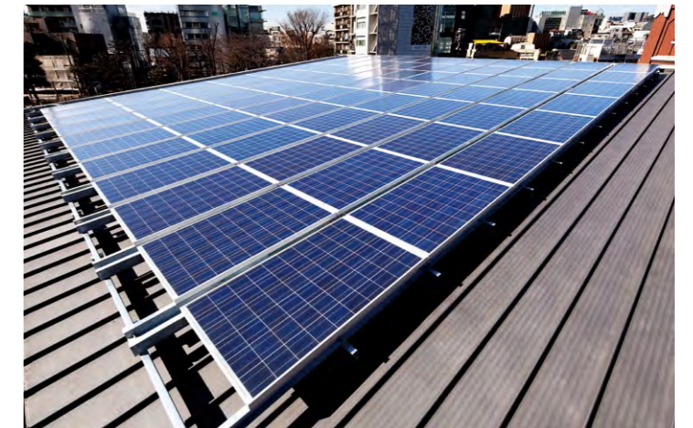
屋上に太陽電池モジュールを88台設置

■恵比寿ガーデンプレイス 所在地 東京都渋谷区恵比寿、目黒区三田 所建築主 / サッポロ不動産開発株式会社 工 / パナソニックESエンジニアリング株式会社 竣工 / 2011年12月