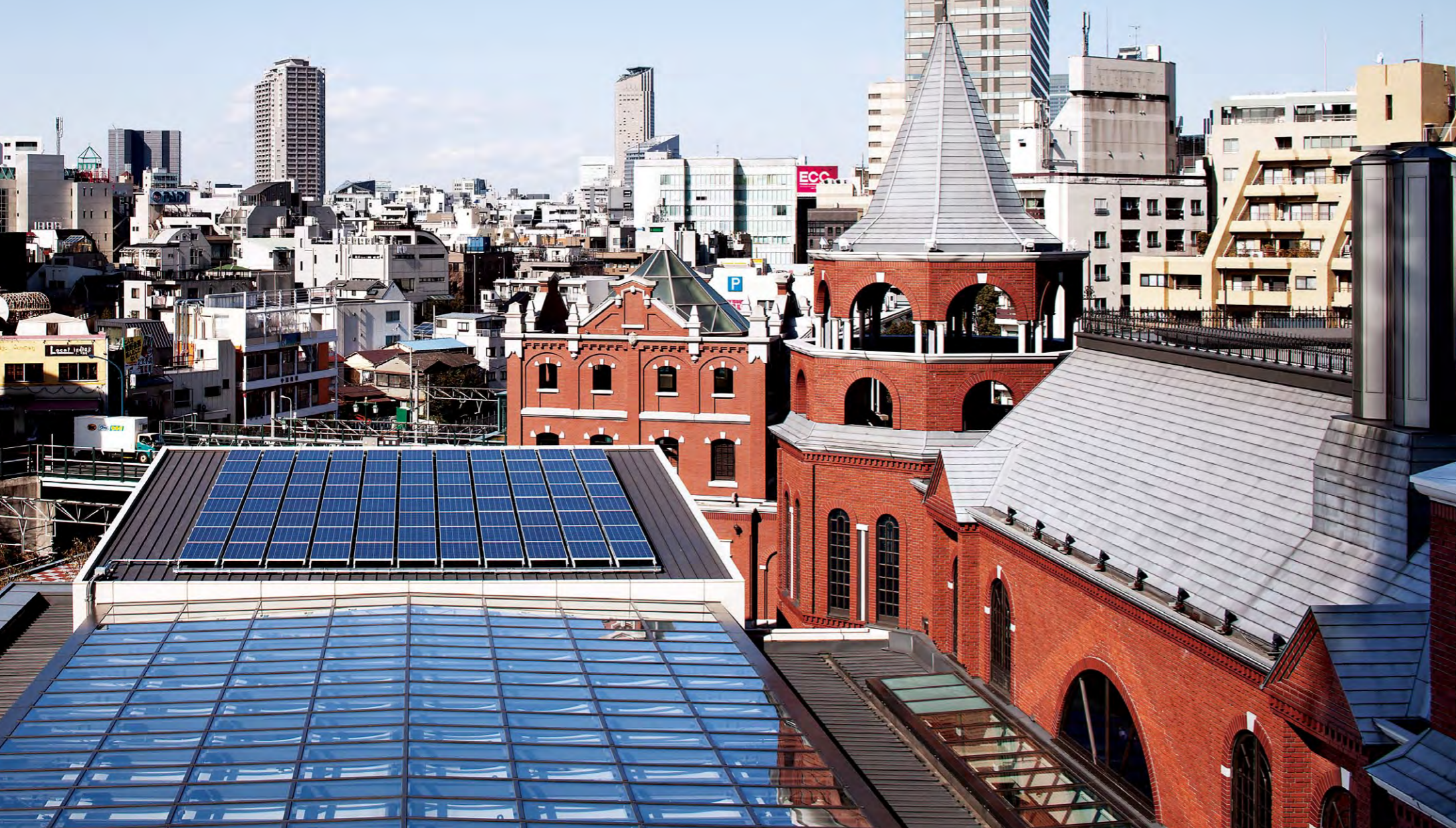
ガラススクエア屋上に設置された太陽電池モジュール