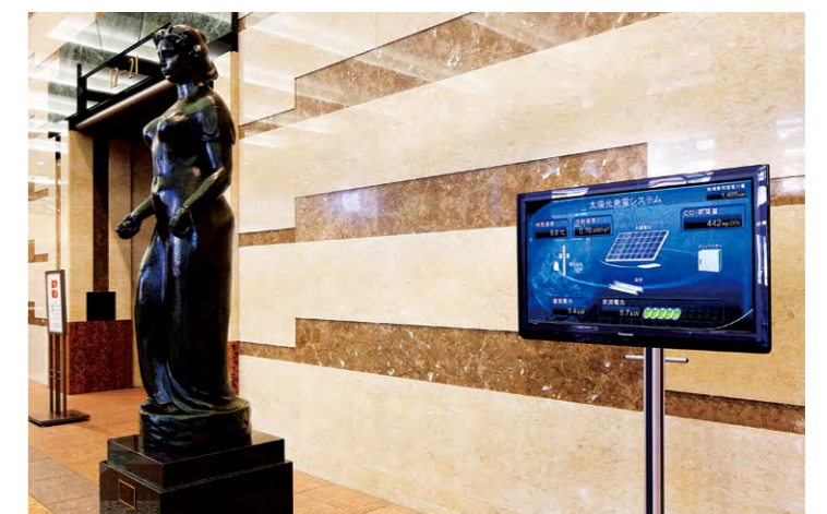
エントランスに設置された太陽光発電電力量パネル