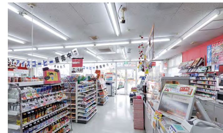
停電時には、蓄電池からPOSレジスターや一部の店舗内照明に電力が供給される

■サークルK 一宮花池店 創蓄連携システム 所在地/愛知県一宮市花池 施工主/株式会社サークルKサンクス システム施工/パナソニックES産機システム株式会社 システム竣工/2012年2月