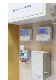
太陽光発電や消費電力を計測してデータを収集