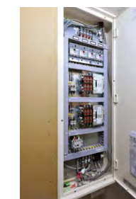
創・蓄連携を実現する蓄電池バックアップ用切替盤