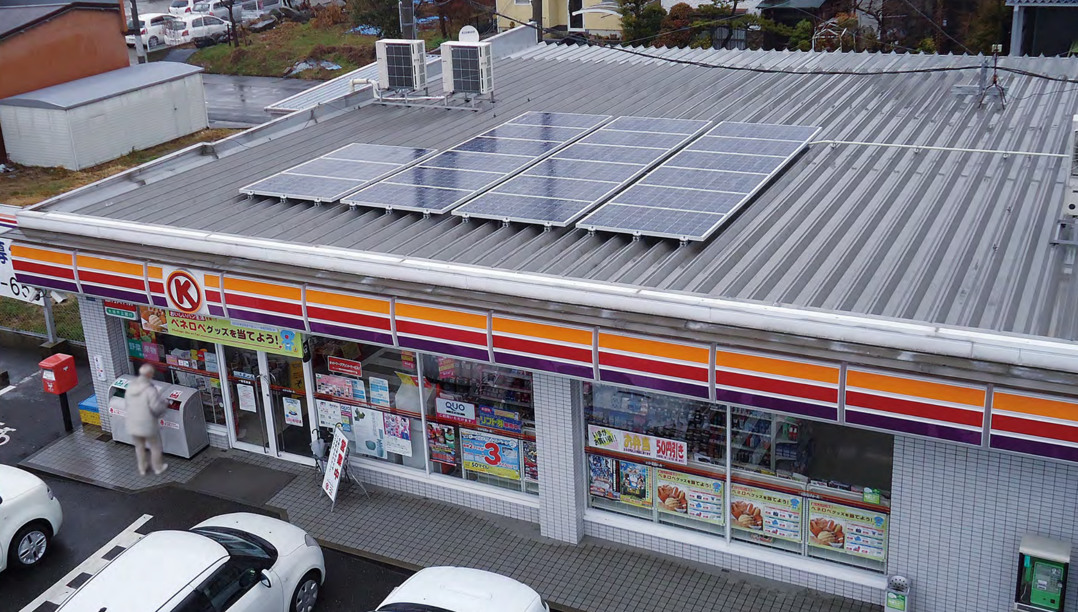
店舗屋上に設置された4.77kWの太陽電池モジュール