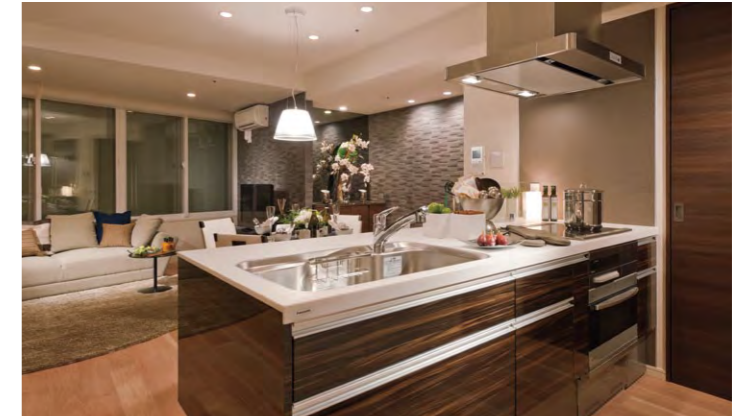
キッチンからリビング・ダイニングを望む

■川崎ゲートタワー 所在地 / 神奈川県川崎市幸区大宮町 施工主 / 川崎市住宅供給公社 建築設計 / 清水建設株式会社 内装工事 / パナソニックES集合住宅エンジニアリング株式会社 竣工 / 2012年7月