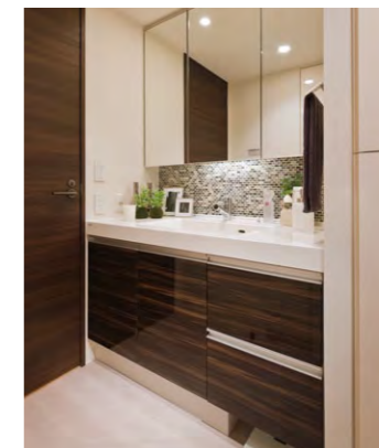
カラーコーディネートされた洗面化粧台