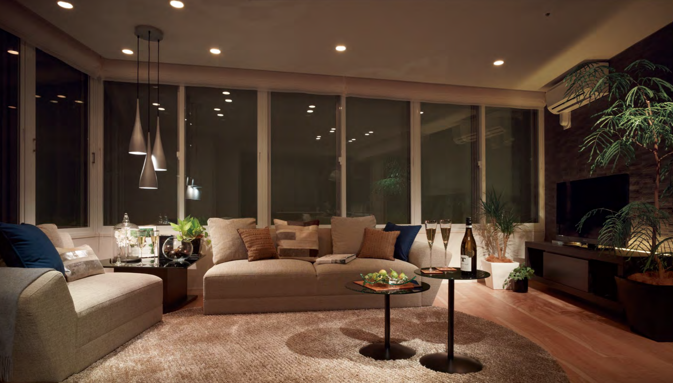
2面に開口部が設けられ、パノラマビューが満喫できる広々としたダイニング・リビング