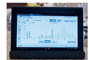
エネルギー「見える化」だけでなく、スマート家電の制御も可能なタブレット