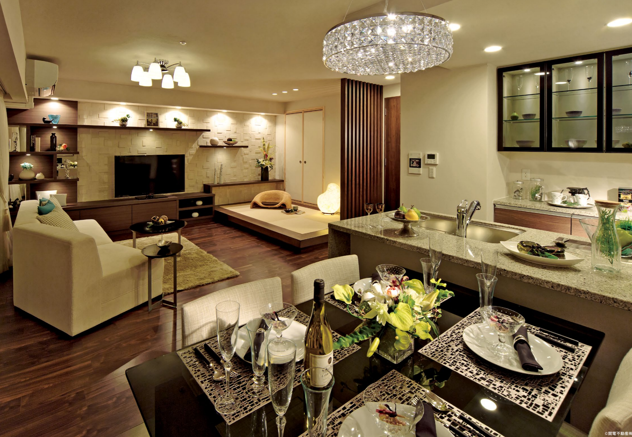
スマート生活スタイル「イー・リズム」により、無理のない省エネを実現（掲載写真はモデルルームLDK）