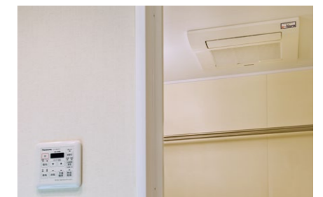
関西電力と当社が共同開発したヒートポンプ式浴室乾燥機