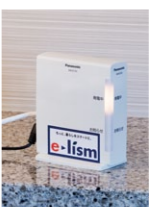
スマートHEMSの核となるAiSEG