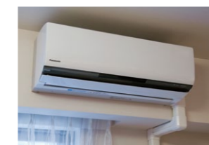
LDKに標準装備され頭寒足温を実現する、ナノイー付エコナビ搭載エアコン