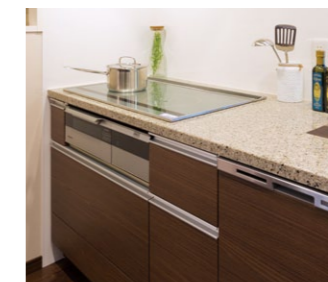
エコナビ搭載IHクッキングヒーターと食器洗乾燥機

高効率なIHクッキングヒーターや食器洗乾燥機などの住宅設備により意識せずに省エネを実現