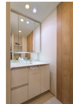
洗面台上部DLに「美光色」を採用