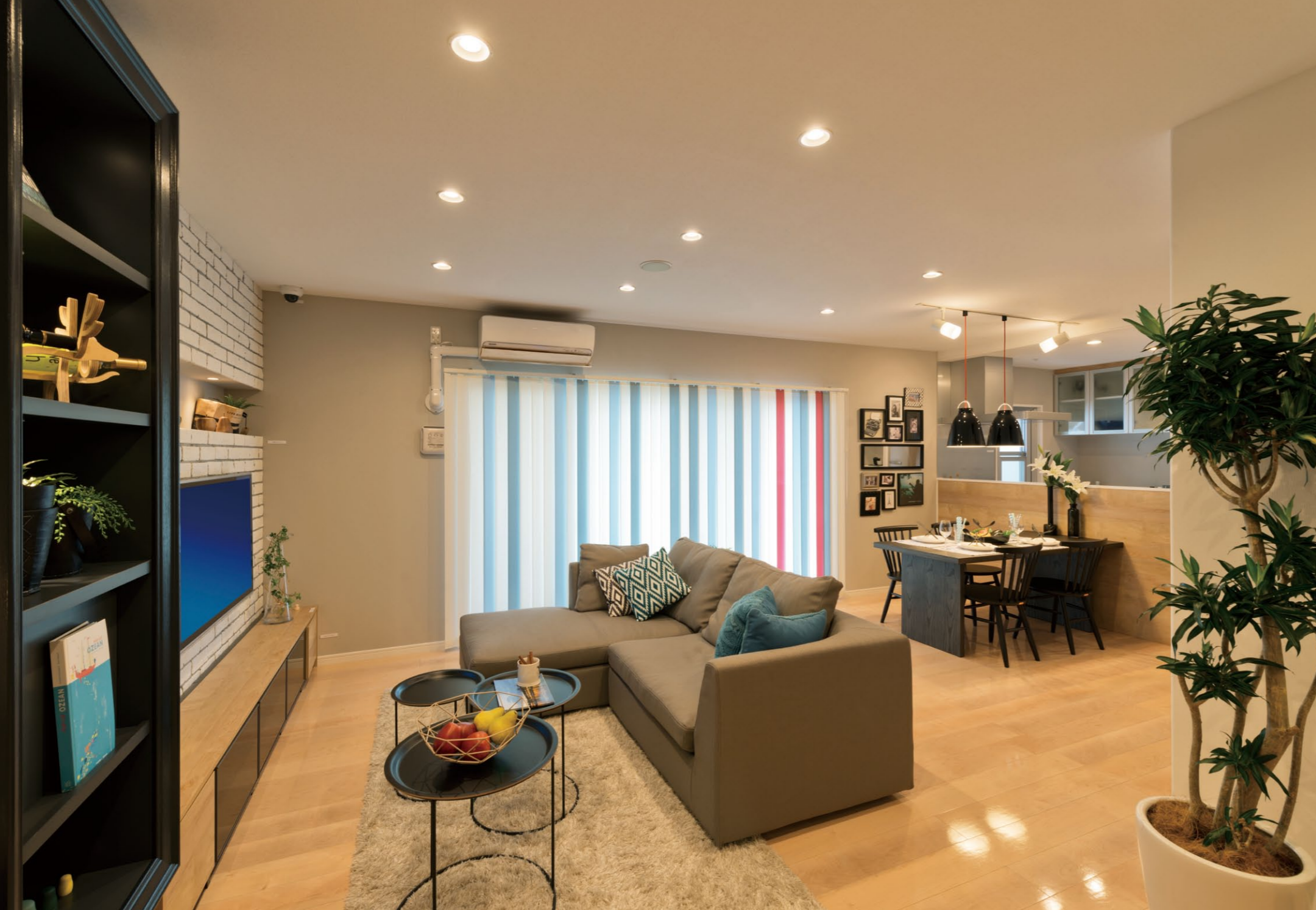
天然木の自然な触感が再現された床材「i-t(イータ)」を用い、同柄のリアロシートで統一されたキュービオスやキッチンカウンターがLDKの統一感を演出している