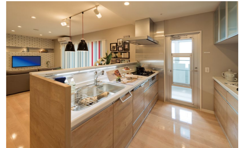
システムキッチンとカップボードのキャビネットにもリアロシートを採用

所在地 / 福岡県筑紫野市大字俗明院 事業主 / 新栄住宅株式会社 設計 / 株式会社司建築設計事務所 施工 / 株式会社福田組 内装工事 / パナソニックES集合住宅エンジニアリング株式会社 構造・階数 / 鉄筋コンクリート造・地上11階 総戸数 / 60戸 竣工 / 2015年9月(予定)