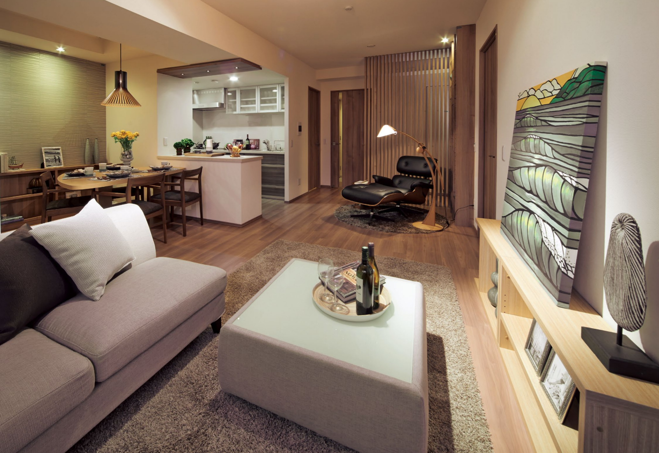
中央に開放的なリビング・ダイニングを配した寛ぎの空間