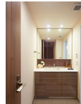
有機ガラス系新素材を用いた洗面カウンター