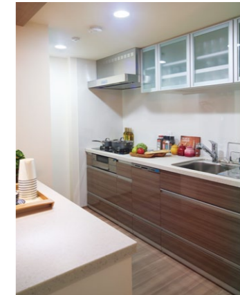
ガラスストップコンロを備えたキッチン

所在地 / 神奈川県横須賀市若松町 事業主 / 株式会社ナベシー、株式会社ヤマザキ 設計・監理 / 岩本建築計画設計、株式会社久米設計 施工 / 東急建設株式会社 内装工事 / パナソニックES集合住宅エンジニアリング株式会社 構造・階数 / 鉄筋コンクリート造 地上26階地下2階 総戸数 / 280戸(管理事務室含む) 竣工 / 2015年8月(予定)