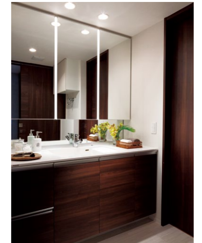
顔に影がでにくい「ツインラインLED照明」の洗面ドレッシング