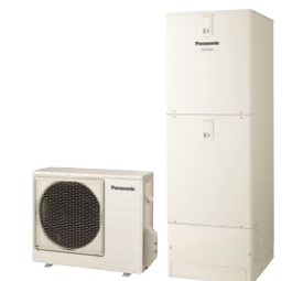
高圧一括受電対応エコキュート