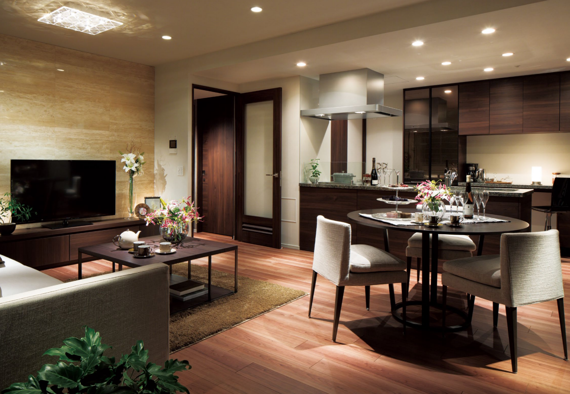
戸境や天井の小梁の出が抑えられ、すっきりとした開放的な空間がつけられたLDK

集合住宅のスマートライフを実現する高圧一括受電対応エコキュートを採用。未来に向けて、これからの暮らしに真に大切なことを見つめ直すことからはじめた271邸のレジデンス、「プラウドシティ新川崎」。2駅3路線の360°アクセスと新旧豊かな住環境に囲まれた舞台。野村不動産株式会社と株式会社ファミリーネットジャパンは、1次消費エネルギー量約20%削減に向け、日本初のマンションエネルギーマネジメントシステム「エネコックe」を共同開発*した。電力をまとめて購入（一括受電）。そして自然エネルギーの太陽光発電等と情報通信技術を組み合わせ、さらに電力使用のピークカット・ピーク