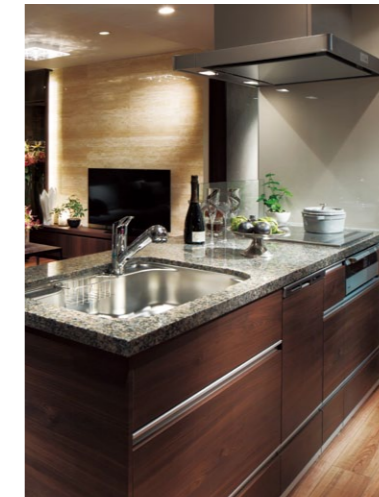
天然石をカウンタートップに用いたシステムキッチン

プラウドシティ新川崎 所在地 / 神奈川県川崎市幸区塚越 事業主 / 野村不動産株式会社 設計 / 三井住友建設株式会社 横浜支店 施工 / 三井住友建設株式会社 横浜支店 内装工事 / パナソニックES集合住宅エンジニアリング株式会社 構造・階数 / 鉄筋コンクリート造・地上7階 総戸数 / 271戸 竣工 / 2015年3月(予定)