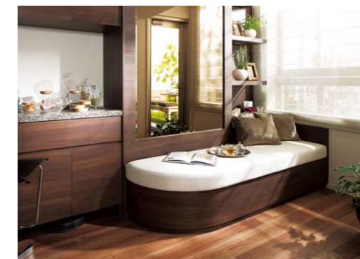
ベランダ側に配置された、ガラスの温室を意味する「コンサバトリー」