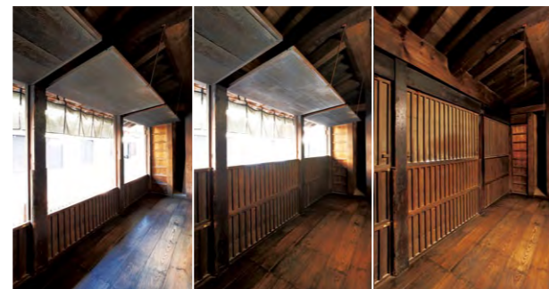
蓐帳の中・下段は柱の溝にはめ込み、跳ね上げ式の上段はつり金具を外して閉じた。戸締まりの済んだ夜のみせは使用人の寝所となった