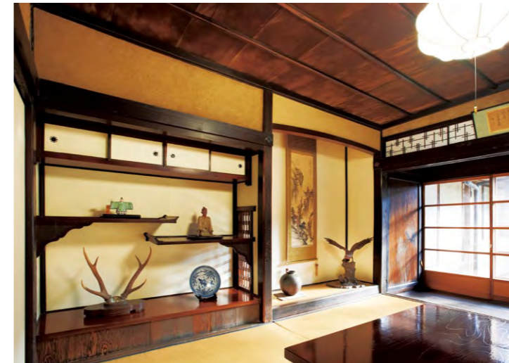
床の間、床脇を備えたざしき。ここで大切な来客を接待した。天井板や縁側の板戸は貴重な屋久杉材である。壁は土壁に襖紙を貼ったもので、汚れた時に貼り替えやすいようにした