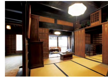
みせの奥にあるよござは主人の仕事場。八百万の神を祭ったという神棚がある。右手は主人夫婦の寝所兼なんど