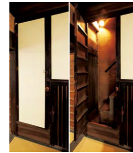
隠し階段の扉は白い壁のように見える。階段はここにしかなかった