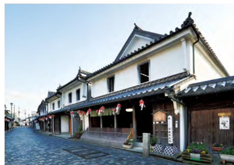
国森家住宅は白壁の町並み(重要伝統的建造物群保存地区)の中心に建っている。正面のひさしも高さがそよい、美しい

仕組みもある。土戸は板戸に土や漆喰を塗り重ねたもので、火災時は1本引きの溝に数枚の土戸をはめ、隙間に味噌を塗って密閉。もらい火を防いだという。防火対策によって屋根が重くなるため、二重梁式和小屋組にしているのも特徴。梁を支える2階の4本の柱は1階よござの四隅の柱と同じ位置にあり、通し柱に近い構造である。1階の柱は礎石に載せただけであり、この構造で耐震性を高めたともいわれる。国森家住宅はこうした特徴を良く残し、近世の商家の史料として貴重である。