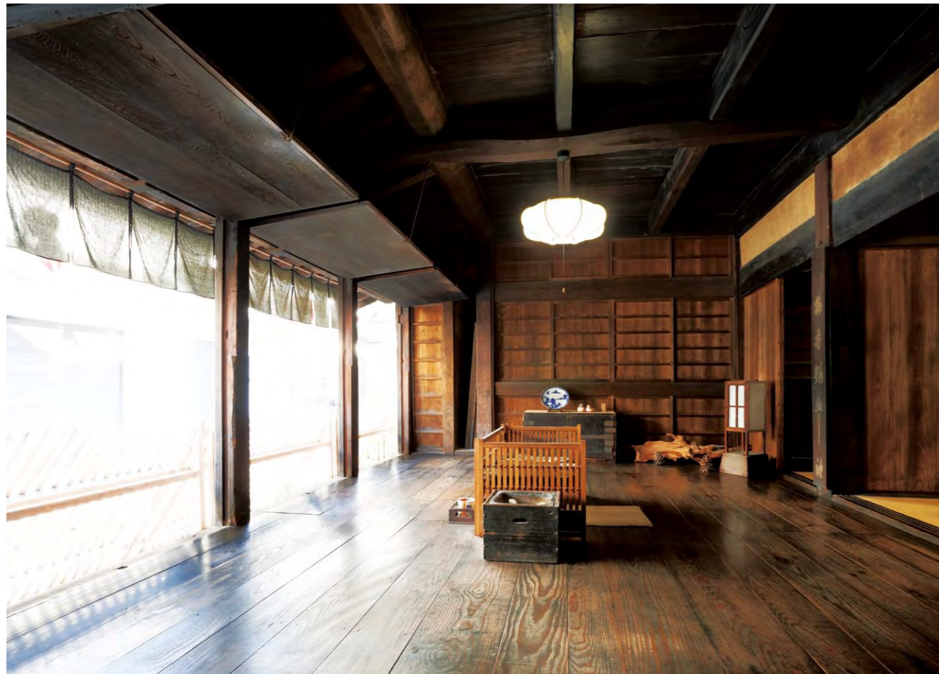
蓐帳を全開し、営業中のしつらえにしたみせ。客は通りからみせに上がったり、みせ先に腰をかけた。跳ね上げた蓐帳には軽い物なら載せられた(犬矢来は後世のもの)

山口県柳井市柳井津は江戸期には岩国藩の御納戸(商都)として栄えた土地で、国森家住宅はその中心に建つ油商の本店。建物は商家としての機能性に優れ、また、当時、柳井津が4度の火災に遭った経験から随所に防火対策を講じている点にも特徴がある。国指定重要文化財。