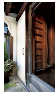
漆喰仕上げの土戸。隙間なく閉じて火を防いだ