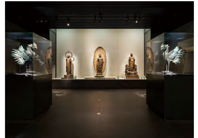
ライティングにより周囲から浮き立つような迫力ある展示を実現