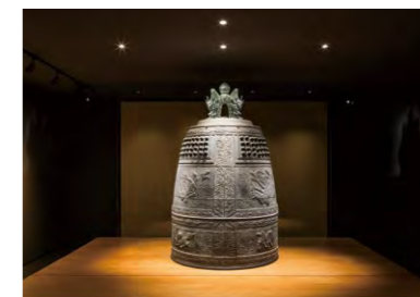
国宝「梵鐘」が持つ青銅本来の美しさを再現