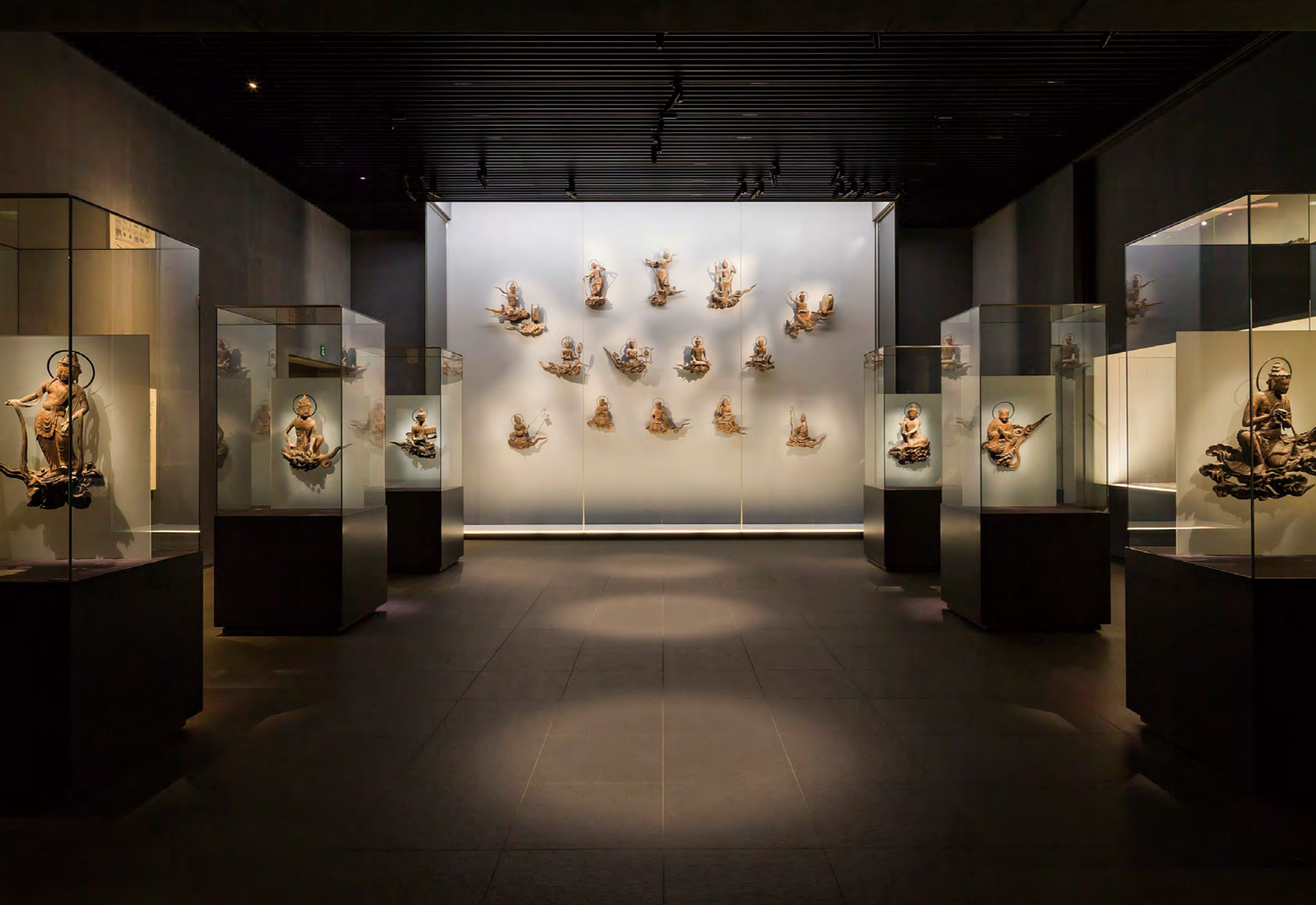
東京国立博物館 木下氏の「薄く光っている雲の中から仏様がふっとお出ましになるイメージ」という指示に基づいて演出された国宝「雲中供養菩薩像」26躯