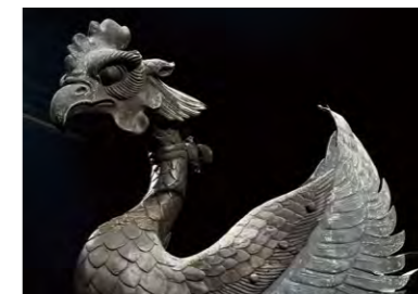
国宝「鳳凰」では1体に5灯のスポットライトで造形の美しさを表現