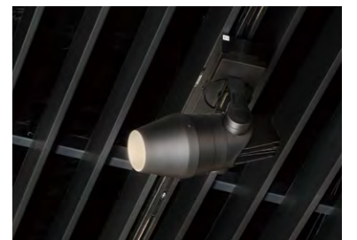
スマートフォンで操作可能なシューティングスポットライト