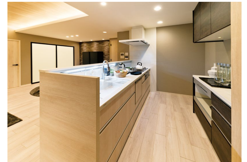
コミュニケーションがとれる対面キッチンでありながら、手元は隠して便利機能をスマートに配置

所在地 / 広島市安佐南区大町東 施主 / 株式会社良和ハウス 設計・監理 / 株式会社アートライフ 施工 / 三栄建設株式会社 構造 / 鉄筋コンクリート造 地上13階 総戸数 / 36戸 竣工 / 2018年2月（予定）※