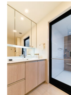
汚れをはじく清掃性に優れた有機ガラス系新素材を用いたカウンター