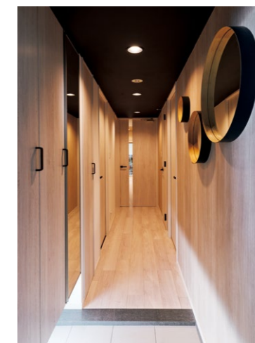
ベリティス柄で統一された、天井までのハイドアとトール下駄箱が印象的な廊下