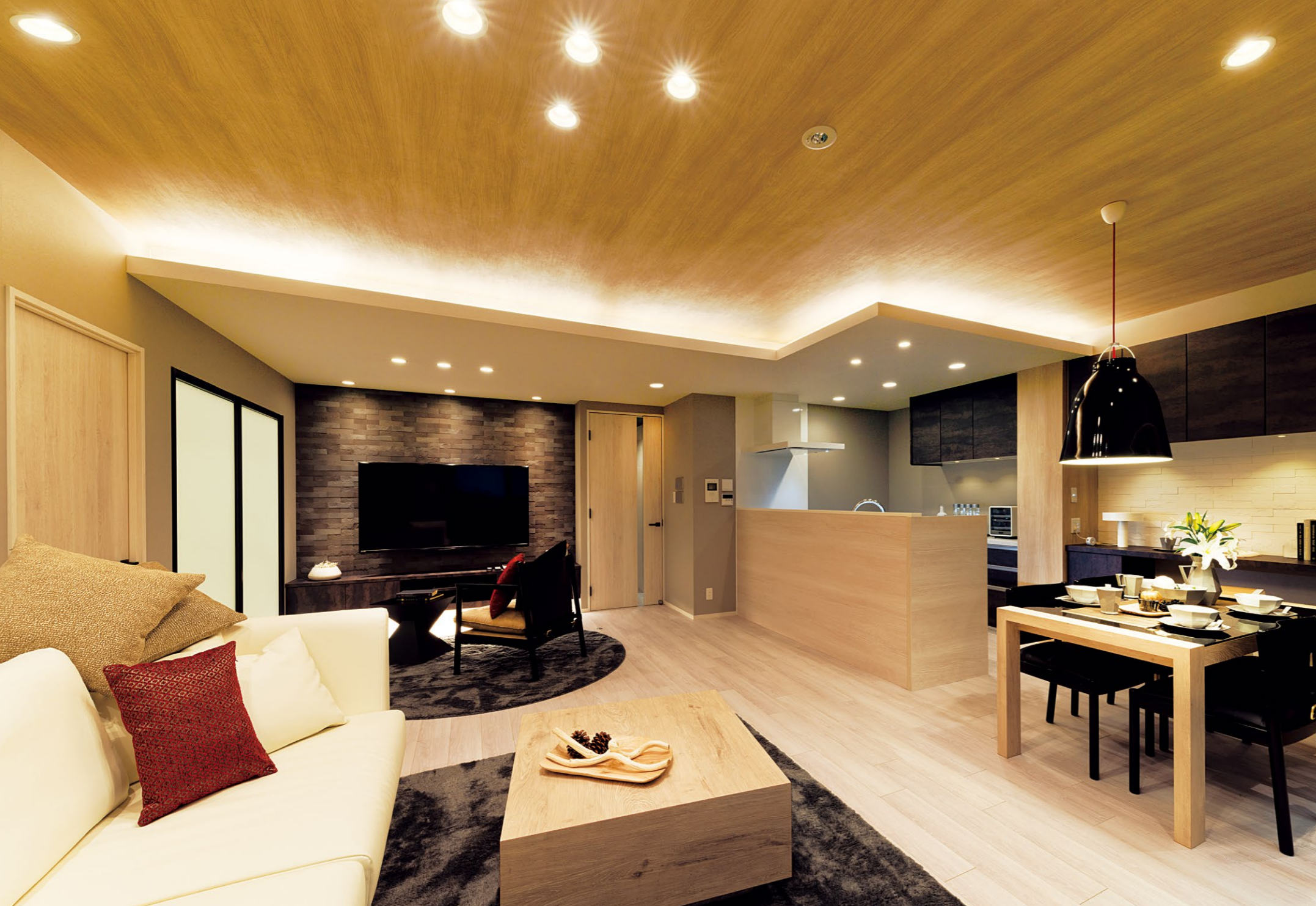
ベリティス柄でトータルコーディネートされ、上質な空間が実現されたリビング・ダイニング