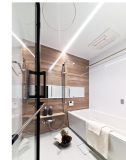
弓形・ストレート形状の浴槽がセレクトできるバスルーム