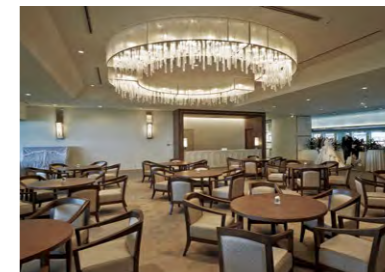
落ち着きの中に華やかさのあるロビー