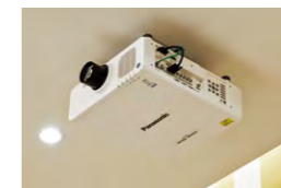
マグノリアホールのプロジェクター