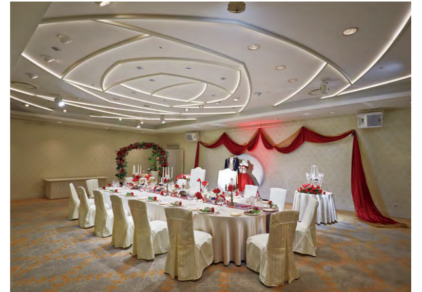
バラの花弁をモチーフにデザインされた建築化ライン照明で華やかさを演出した中宴会場「ローズルーム」

■宴会場リニューアル工事 所在地 / 千葉県浦安市舞浜 施工主 / オリックス不動産投資法人 株式会社プラザサンルート デザイン / 株式会社メック・デザイン・インターナショナル 施工 / 鹿島建設株式会社 電気工事 / 浅海電気株式会社 リニューアル竣工 / 2017年8月