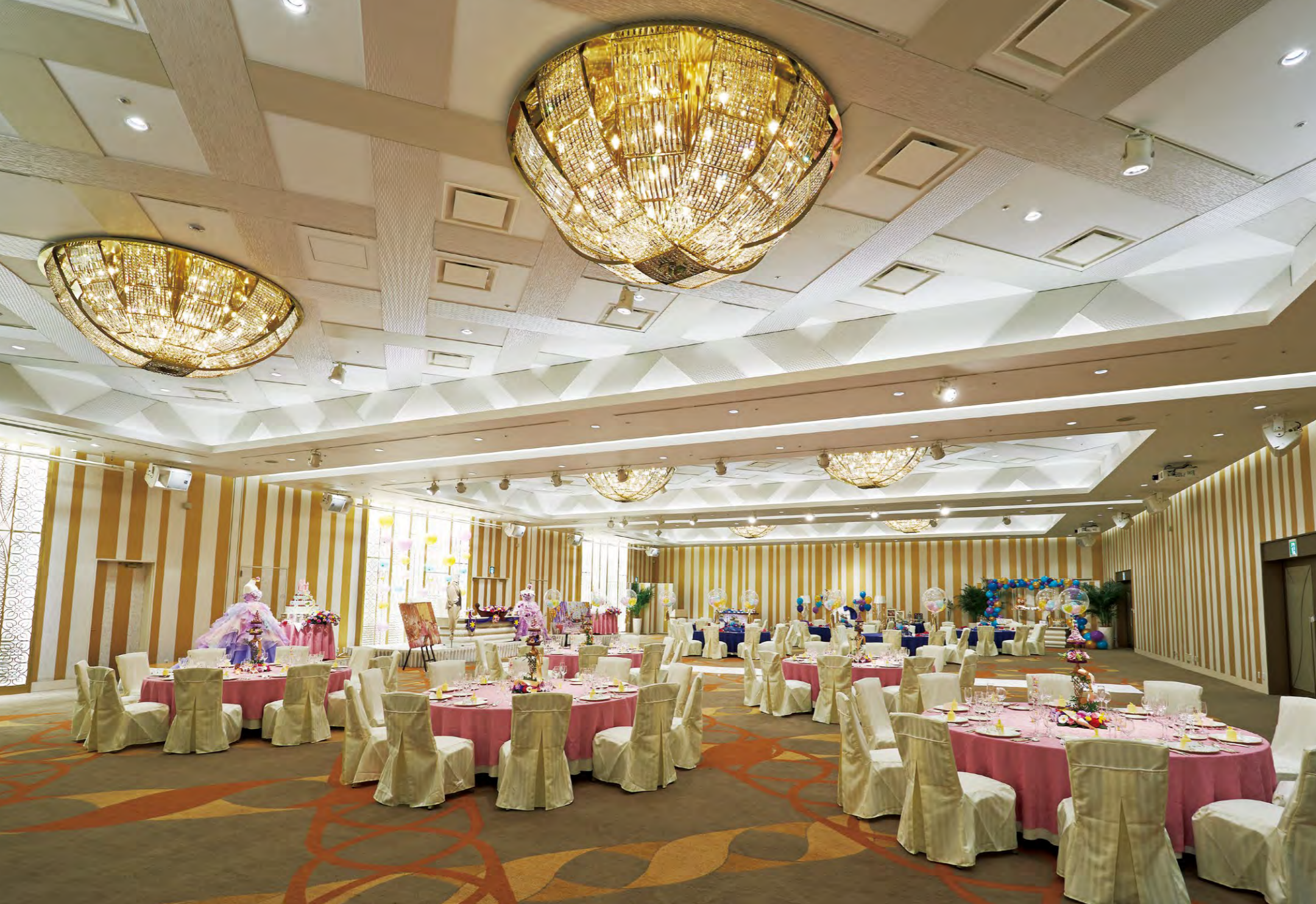
天井と絨毯に合わせてシャンデリアにもリボンの意匠を用いた大宴会場「マグノリアホール」

白く煌めくLEDシャンデリアで全宴会場の照明設備をリニューアル 東京ディズニーランド®がグランドオープンした1983年から3年後、隣接してサンルートプラザ東京が開業した。現在6軒あるオフィシャルホテルの中で最初に開業したホテルで、上層階からは東京ディズニーランド®・東京ディズニーシー®・ディズニーリゾートラインが一望できる。その魅力的な立地から「舞浜ウェディング」という言葉が誕生し、宿泊だけでなくブライダルに欠かせない施設として利用されてきた。大中小7室ある宴会場は、結婚式の披露宴会場をはじめコンベンションやセミナーなどにも用いられている。