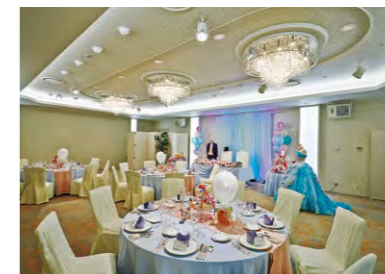
白を基調にしたエレガントな雰囲気の中宴会場「カトレアルーム」