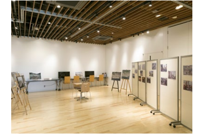
さまざまな作品が展示できる展示室(2階)