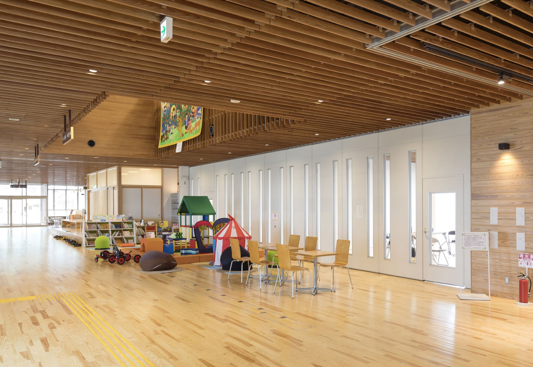
自在に間仕切りが可能な2階の多目的室(右)と和室(左)は交流機能の中核として市民にも活発に利用されている