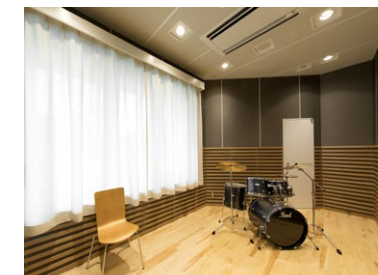
防音設備が整ったミュージックスタジオ