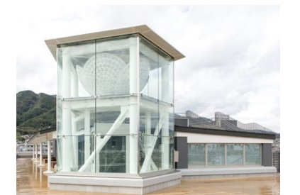
椿のモニュメント(中央)と背後の備蓄倉庫