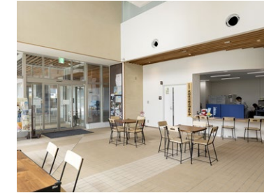
大船渡市観光物産協会事務所(1階)

所在地／岩手県大船渡市大船渡町 主 大船渡市 管 一般社団法人大船渡市観光物産協会 計 株式会社NTTファミリーーズ 理 株式会社日東設計事務所 工 東急建設・明和土木特定建設工事共同企業体 竣 2018年4月