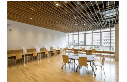
学生が自由に利用できる自習室