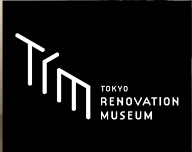
リノベーションのノウハウを満載した体験型施設を開設

大規模改修により機能の高度化を図ることで、建築に“新たな価値”を与えるリノベーション。近年、新築マンションの価格高騰により、中古マンションを購入し、リノベーションを実施するといった需要も増加傾向にある。ライフステージの変化に伴い、暮らしが変わるときには住まいの見直しが必要になる。しかし、暮らしが各人によって異なるように、リノベーションも多様。このため、マンションリノベーションに際して、何から始め、どう進めれば良いかわからないという声も多い。 パナソニックは、リノベーションとは「新築時を超えた“新たな価値”を実現する行為」と捉え、このたび、今後高まるリノベーション需要に対応するため、「TOKYO リノベーション ミュージアム」を開設した。 本施設は、リノベーションの知識を学び、リノベーションで得られる暮らしに憧れを感じ、そしてリノベーションへの想いを実現するという、リノ