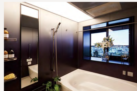
壁パネルは4種類のカラーセレクトから選択でき、天井の照明は調光調色システムで雰囲気を変えることができる