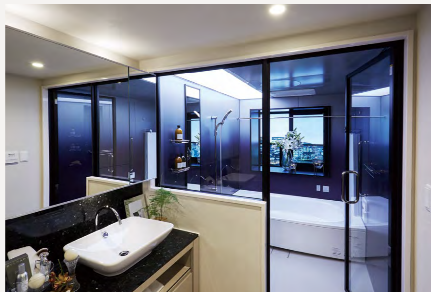
エグゼクティブフロアの角住戸に採用された1822サイズのi-X INTEGRAL

所在地／大阪市中央区南本町 建築主／九州旅客鉄道株式会社 設計・監理／株式会社INA新建築研究所 建築工事／西松建設株式会社 構造／鉄筋コンクリート造一部鉄骨造 地上37階、地下1階建 総戸数／296戸 竣工予定／2021年2月