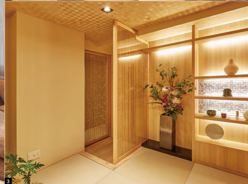
1.小梁のないすっきりとした空間のLDK 2.主寝室と半透明の引戸で仕切られたウォークインクローゼット 3.ジャパニーズモダンの和室