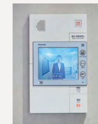
マンションインターホン Windea