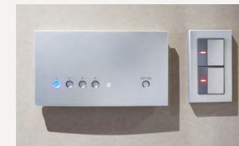
照明パターンが記憶できるシーンマネージャー (オプション)